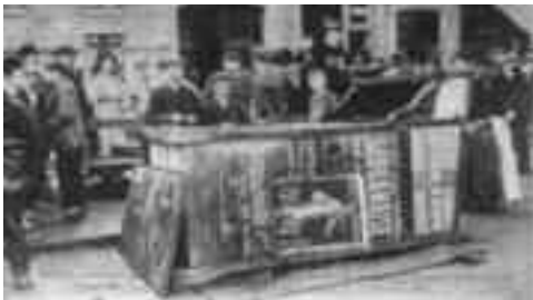
La foule contemplant les vestiges de l'émeute devant l'Ambassade d'Espagne

Le dernier numéro de "La Voix du Peuple" sortira le 14 mai 1850.